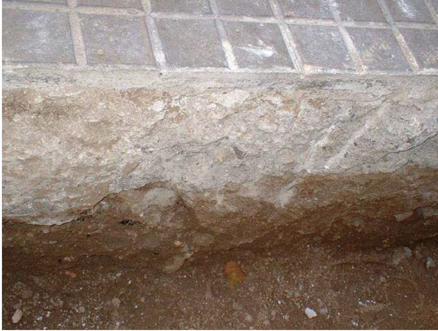
Fotografia 3: Estratigrafia de la Rasa 100.