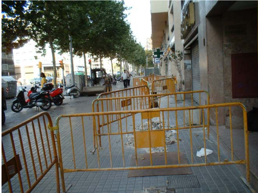
Fotografia 1: Vista general de l'Avinguda del Paral·lel, en el tram afectat per l'obra.