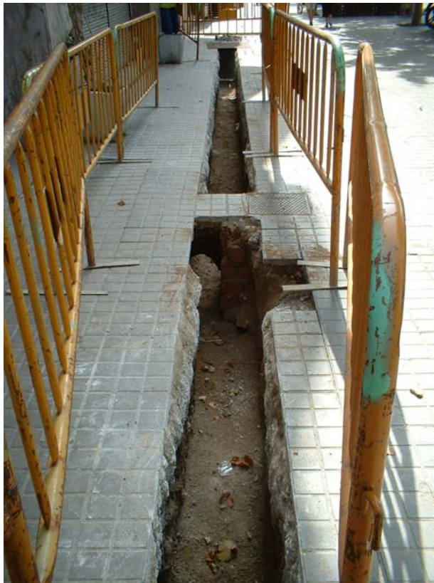
Fotografia 2: Vista parcial de la Rasa 100.